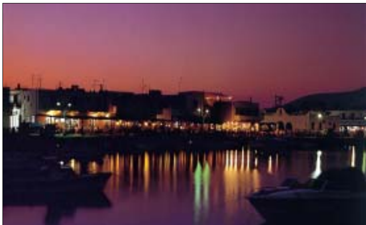
Flaniermeile bei Nacht: Uferpromenade von Kardamena

Neben einfachen italienischen Speisen in großer Auswahl gibt es natürlich auch griechische Hausmannskost, die frisch ist und richtig satt macht.