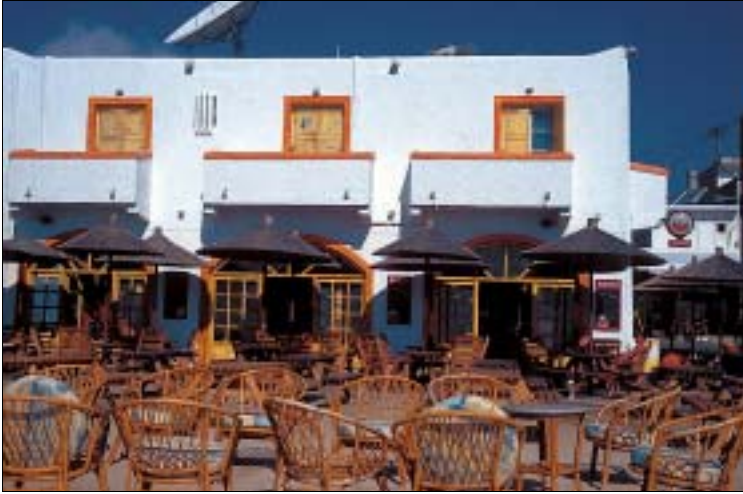
Die morgendliche Ruhe trägt: Nachts ist in den Bars an der Promenade Rambazamba