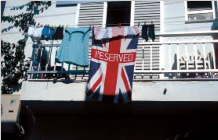
In Katalogen als „English Village“ angepriesen: Kardamena

Zentrum des Nachtlebens ist, stellt Lärmbelästigung keine Ausnahme, sondern die Regel dar.