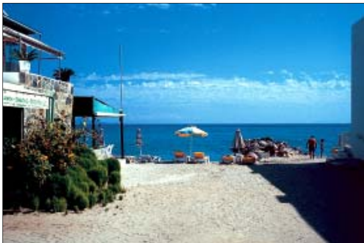
Urlaub der kurzen Wege: Strand, Schirm, Snackbar

wechselnd – mal steinig, dann wieder feinsandig. Rund 200 m östlich des Clubs Malibu sorgt ein kleiner Tamariskenhain für Schatten. Je weiter man sich in Richtung Osten bewegt, umso sauberer, breiter und feinsandiger wird der Strand.