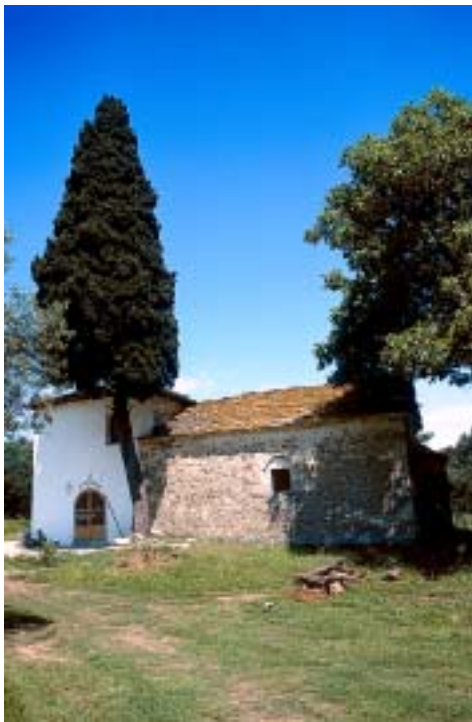
Unterwegs kommt man immer wieder zu schönen Kapellen

Auf dieser Piste geht es zunächst aufwärts, später dann leicht bergab. Etwa 1,5 km nach der zuletzt genannten Abzweigung kommt man zu einer Platane , durch deren gespaltenen Stamm man hindurchkriechen kann (WP 09). Kurz darauf erreicht man eine markante Gabelung (WP 10) mit einer eingefassten Quelle gegenüber von Tierställen. Biegen Sie hier nach rechts ab, kaum 500 m weiter halten Sie sich links (WP 11) und gleich danach, wo der Weg zum Ipsáriorion abzweigt, wieder links. Nach kurzer Zeit passiert man eine Platane, durch deren Stamm man eine Quelle gelegt hat. Vorbei an Bienenstöcken und Ställen erreicht man nach einem weiteren Kilometer die Dorfstraße von Potamiá gegenüber von dem winzigen Johanneskapellchen (WP 12). Rechts kommt man in wenigen Minuten zur Platía, wo man Rast machen oder auch in den Bus zurück nach Panagía einsteigen kann. Zur Fortsetzung der Tour wandert man von WP 12 auf der Dorfstraße ca. 130 m bis zum Sacharoplastion (WP 13) und zweigt schräg gegenüber in einer Rechtskurve in eine steile Gasse nach links ab, rote Markierungen weisen den Weg. Kurz darauf hält man sich an einer Gabelung (WP 14) links, unmittelbar danach rechts und wandert auf ei-