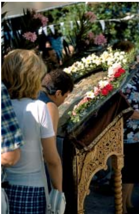
Mariä Himmelfahrt in Panagia

Fast genau schräg gegenüber der Kirche liegt etwas tiefer als die Straße ein Platz, an dem es schon wieder rauscht. Aus drei unterschiedlich eingefassten Quellen – nach ihnen hat der Platz auch seinen Namen „tris Pigés“ – strömt das