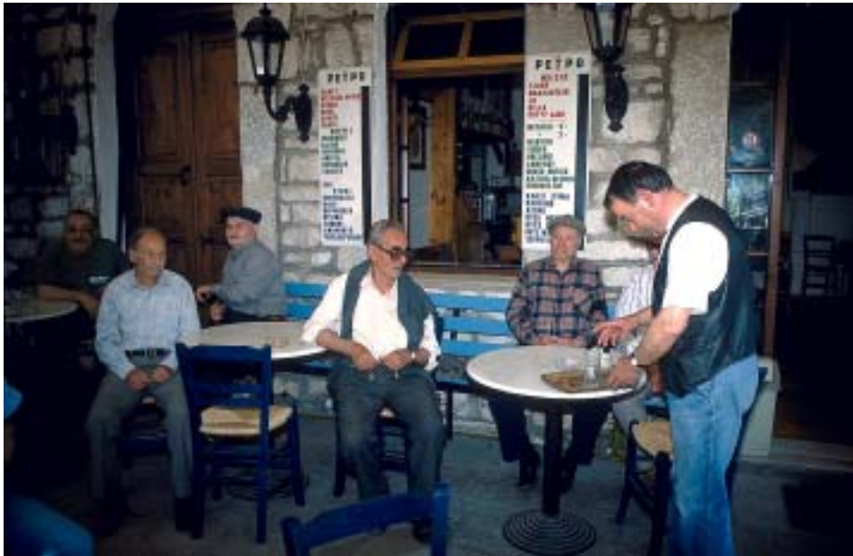
Die Bergdörfer haben viel Atmosphäre